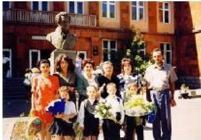
یوم‌نامه گنجینه مهر 1 تا 10 اردیبهشت 1398، جشنواره فرهنگی و هنری دانش‌آموزان و معلمان تهران، اردیبهشت 1398، جشنواره فرهنگی و هنری دانش‌آموزان و معلمان