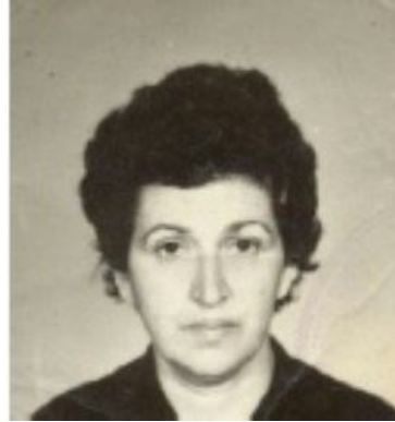
دکتر سیمین آملی، مدیرکل فرهنگ و ارشاد اسلامی